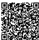
Aluron - Dekor Mat Color Collection 2