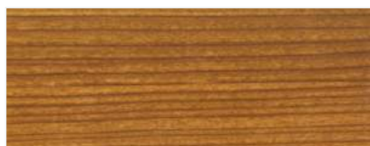
451/1402 - WIŚNIA