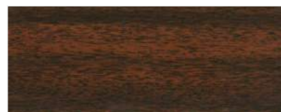
451/1704 - MAHOŃ