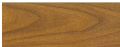
716/1401 - WIŚNIA