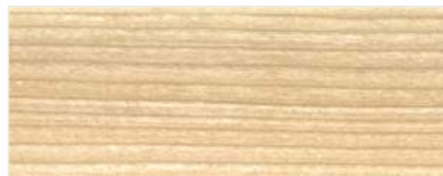
916/1402 - JASNY DĄB