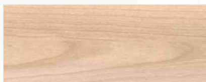
916/1406 - BRZOZA