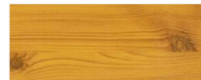
716/2103 - SOSNA

Zaprezentowane powyżej kolory mają wyłącznie charakter poglądowy.