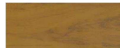
682/2901 - KOŚĆ SŁONIOWA