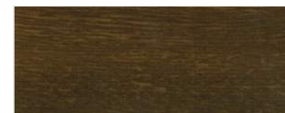
775/2301 - ORZECH