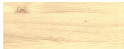
916/2103 - SOSNA