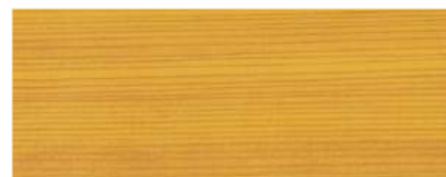
716/1501 - SOSNA BEZ SĘKÓW