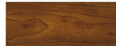
733/1403 - WIŚNIA CIEMNA