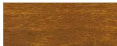
739/2301 - ŻŁOTY DĄB