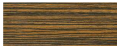
451/2805 - ZEBRANO