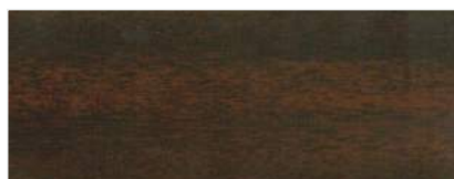
742/1704 - MAHOŃ