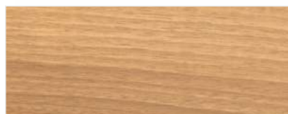
746/1829 - WINCHESTER