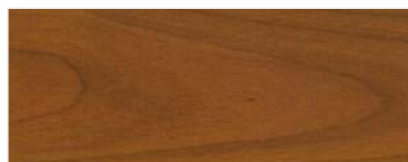
739/1406 - WIŚNIA