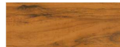
451/2901 - KOŚĆ SŁONIOWA

Zaprezentowane powyżej kolory mają wyłącznie charakter poglądowy. W katalogu przedstawiono tylko część dostępnej palety barw, o pełny wzornik kolorów prosimy pytać Doradców Techniczno-Handlowych.