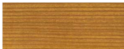
716/1402 - WIŚNIA