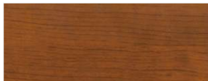
725/1403 - DAGLEZJA