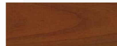
742/1406 - WIŚNIA