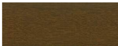
797/2305 - DĄB