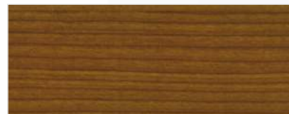
733/1402 - WIŚNIA