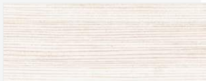
916/1501 - KLON