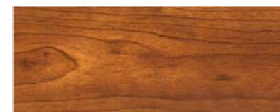
451/1403 - WIŚNIA