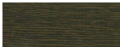
775/2516 - DĄB BAGIENNY