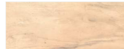
916/2901 - KOŚĆ SŁONIOWA