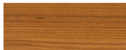
451/1406 - WIŚNIA