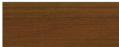
733/1401 - WIŚNIA