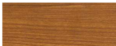
451/1401 - WIŚNIA