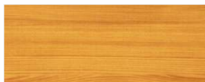
451/2103 - SOSNA